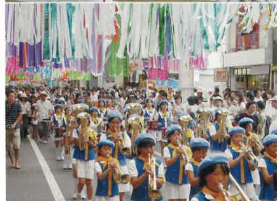
■協力:ボーイスカウト一宮地区・ガールスカウト(愛知56・89団)

■時間/13:40~14:55 ■コース/④コース 地藏寺~本町1丁目 ⑤コース 本町4丁目~本町1丁目