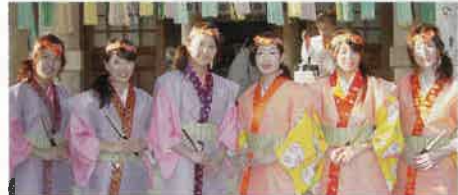
◀ミスセタ・ミス織物も舞姫姿で参加します。