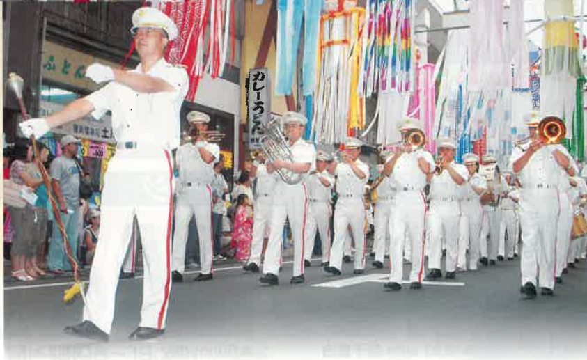
■協カ:ボーイスカウト一宮地区・ガールスカウト(愛知56・89団)