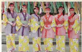
◀ミスセタ・ミス織物も舞姫姿で参加します。