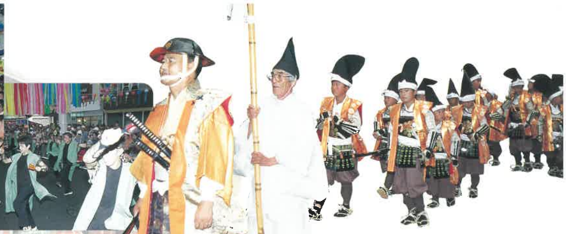
おんぞ ☆御衣奉獻大行列