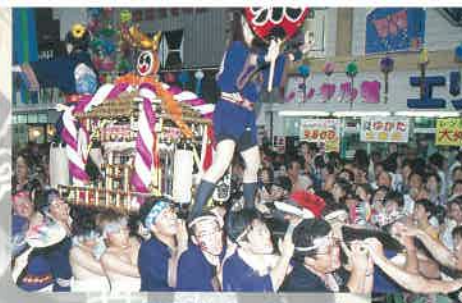
☆躍る七夕パレード