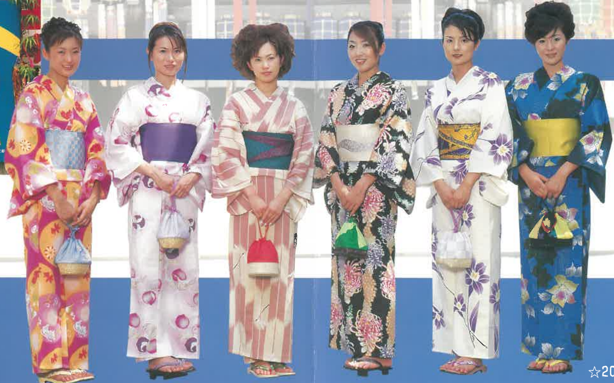
☆2001ミス七夕・ミス織物