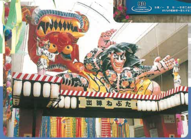
☆仕掛物アーチ飾り