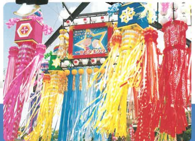
☆大型奉獻 七夕飾り