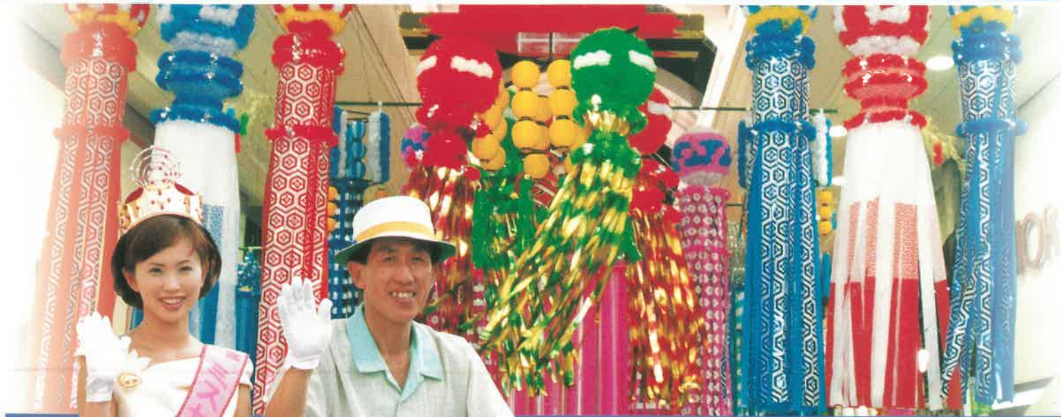
☆七夕吊り下げ飾り