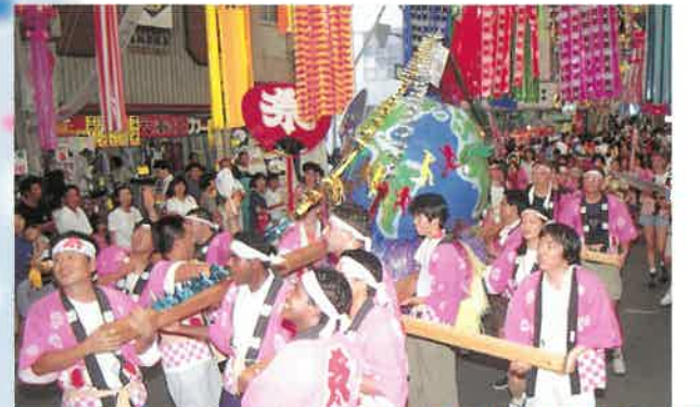
躍る七夕パレード