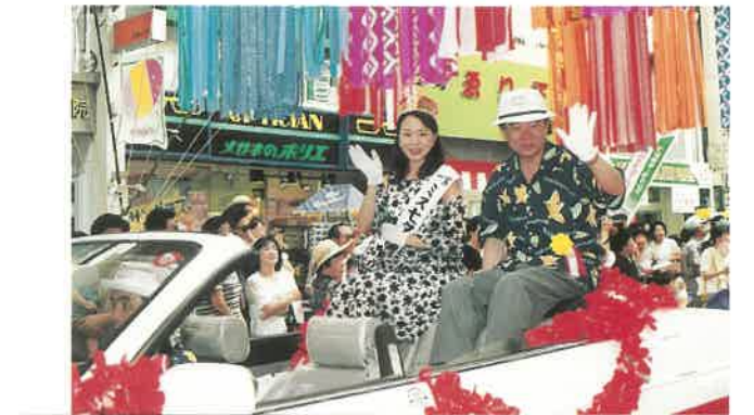
ミス七夕・ミス織物 オープンカーパレード