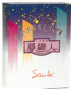
■ゆめおりすとサブレ