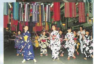
ワッショーーいちのみや