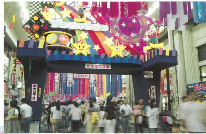
仕掛物アーチ飾り