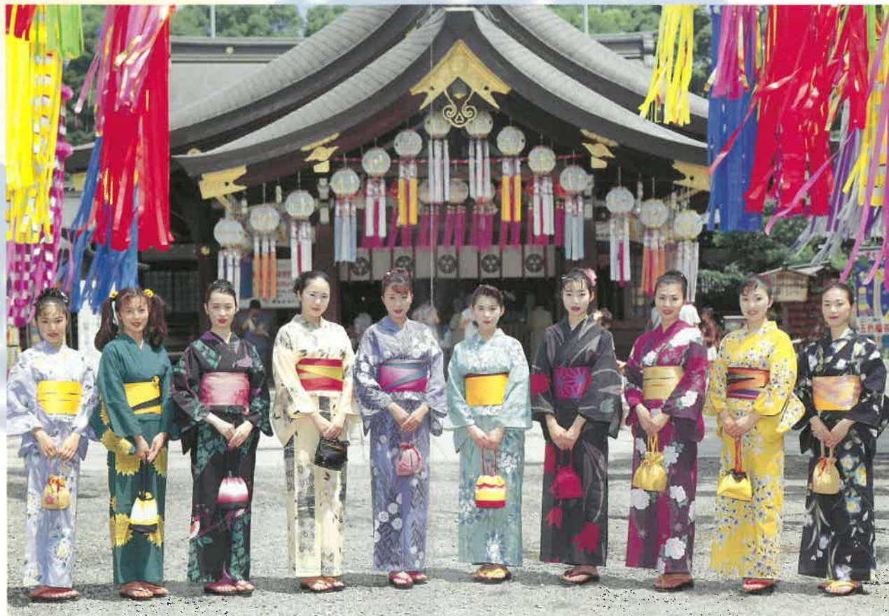
'96ミス七夕・ミス織物