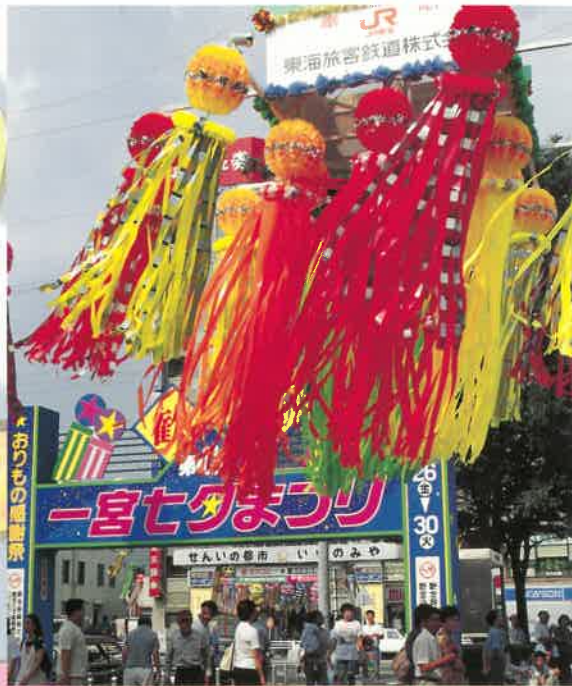
特別奉獻七夕飾り

昭和31年に創設された一宮七夕まつりは、今では市民の夏の最大イベントとして根をおろし、仙台・平塚の七夕まつりと並びその飾り付けのけんらん豪華さは内外の観光客から日本三大七夕まつりの一つと称賛される程で、会期中の人出は150万人をこえる。