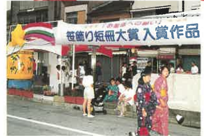
笹飾り短冊大賞 入賞作品