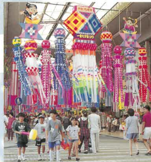
七夕吊り下げ飾り