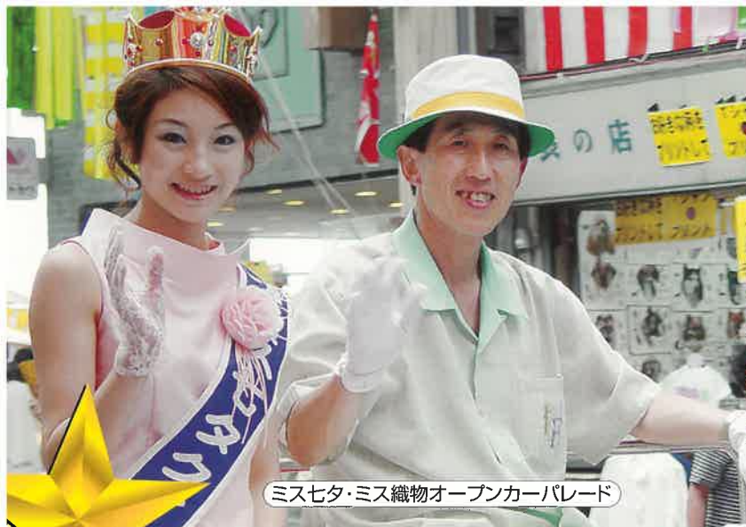
ミス七夕・ミス織物オープンカーパレード