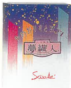
ゆめおりすとサブレー