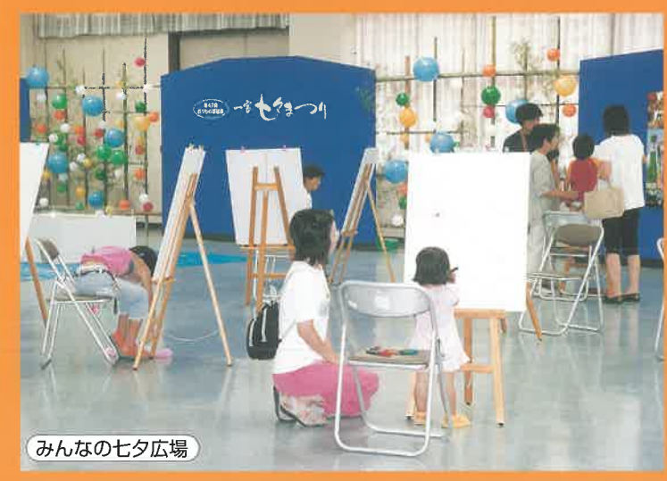
みんなの七夕広場