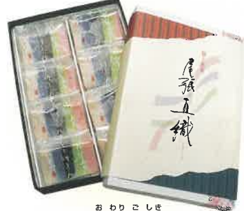
おわりこしほ 尾張五織