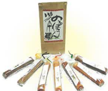
いちのみや 138 のつぼさん