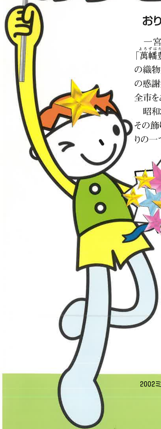
2002ミス七夕・ミス織物

昭和31年に始まった一宮七夕まつりは、今では市民の夏の最大イベントとして根をおろし、その飾り付けのけんらん豪華さは、仙台・平塚の七夕まつりとならび日本の三大七夕まつりの一つとして称賛されるほどで、130万人をこえる人出でにぎわいます。