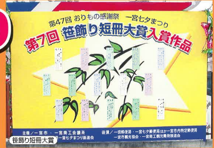
主催／一宮市・一宮商工会議所 後援／一宮郵便局・一宮七夕郵便局ほか一宮市内特定郵便局 一宮市観光協会・一宮商工観光開発推進会