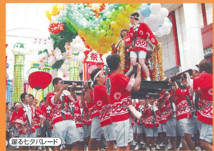
躍る七夕パレード