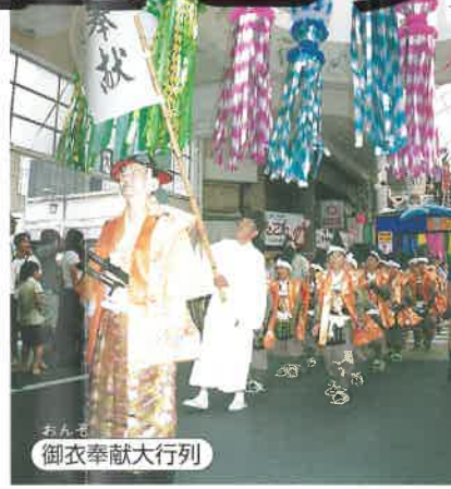
おん祭 御衣奉獻大行列