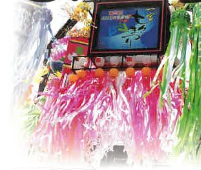
大型奉獻七夕飾り