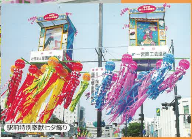
駅前特別奉獻七夕飾り