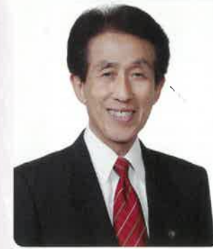
おりもの感謝祭 一宮七夕まつり協進会 会長 一宮市長 谷 一夫

第57回 おりもの感謝祭 七夕で みんなの 笑顔 Ichinomiya Star Festival