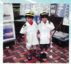
▲子供用制服の試着と撮影会

(BLUE MARINE OPERATION) ■時間/10:00~15:00 ■会場/真清田神社前案内所隣