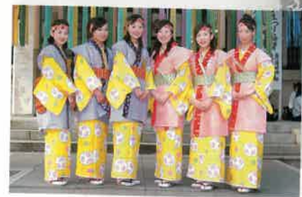
◀ミスセタ・ミス織物も舞姫姿で参加します。

おんそ 御衣奉獻大行列 ■時間/16:30~17:30 ■コース/一宮商工会議所~真清田神社