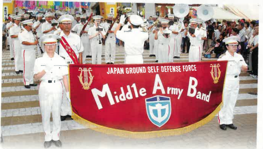
■協力:ボーイスカウト一宮地区・ガールスカウト(愛知56・89団)