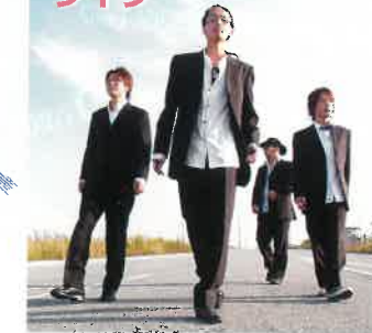
▲Cooley High Harmony