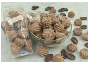
ぼくぼく メレンゲ (チョコ)