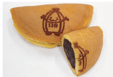
あんこや もっちり焼き