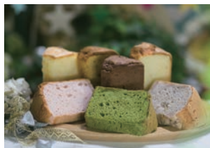
アルビノール シフォンケーキ