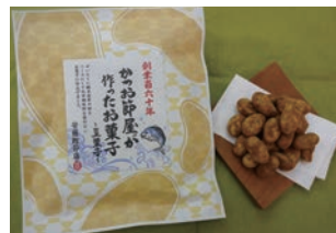
安藤製菓店 かつお節屋が作ったお菓子