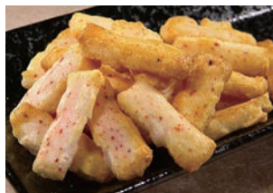
菊一あられ エビスラダ