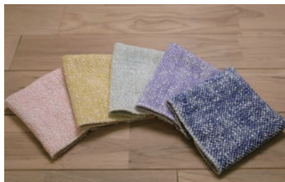
木玉毛織 (ハンカチ)