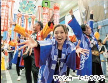
ワッショ〜いちのみや