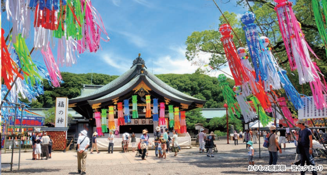
おりもの感謝祭一宮七夕まつり