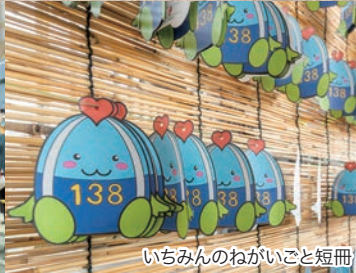
いちみんのねがいごと短冊